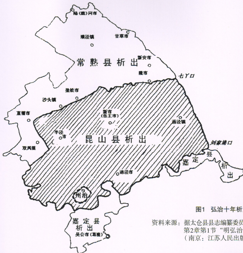
图1 弘治十年析置太倉州示意图